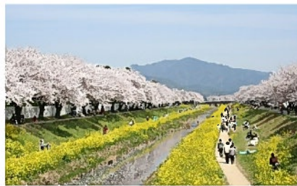
桜と菜の花の競演 佐奈川

さらに、シロサギやカワセミ・セキレイなど賑やかで楽しい川です。以前は、ゴミだらけのドブ川でしたが、近隣の人々の努力で今では綺麗な水が流れ、多くの人が集う素晴らしい環境になりました。