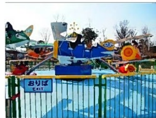
こんな遊具もありました。意外と高くまで上がります。