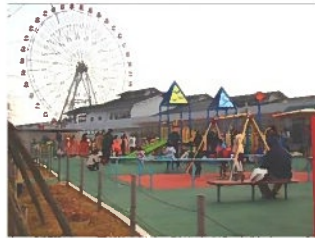
幼児向け遊具コーナー、後ろには名物の観覧車。