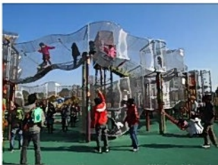
幼児向け(下)と小学生向け(上)でコースが分かれています。

HP: http://www.iwagaike-park.com/index.html 「刈谷市ハイウェイオアシス」で検索