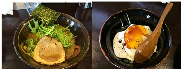
ランチで食べた ↑ 「のーまる」(しょうゆ)

い！でも悔しいのが1度の訪問ではすべての味を試せないこと！ 食べたいものが多すぎて。まんまる堂さんへは高速道路を使えば1時間ほど。射程距離ですね。ビールは飲めないけれど、うーん悩ましい。おなかすいた……。 (記事を書いているのはお昼の12時ちよつと前)