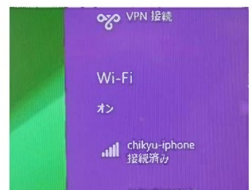
iPhoneにつながっています