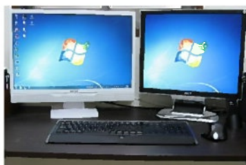
デュアルディスプレイ

本当に世の中が大きく変わりました。パソコンを活用して快適に大幅な生産性向上に役立っています。事務所で