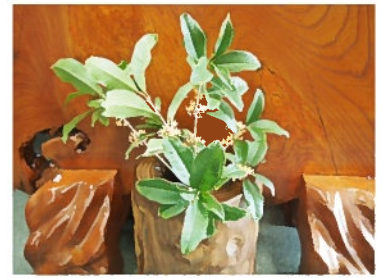
金木犀 (きんもくせい)

隣のおじいさんからは花と木の手入れの仕方を教わりました。また、季節毎にお花をプレゼントしてくれるので事務所に飾っています。