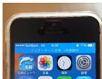
テザリングを使用するとメッセージが出ます