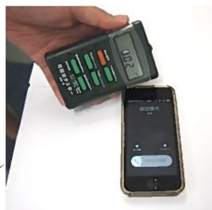
スマホ 0.02mg (右側がスマホです)

携帯電話として、ガラケー・スマホも電磁波を計測しました。以前のハード程、害はないようですが、密着して使うので短時間でお話を終わらせるに越した事はないでしょう。