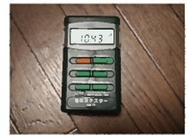
床暖房 10.43mg (電気カーペット)