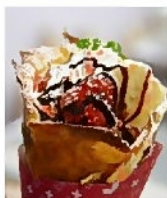
ふっくらもちもちした 生地が美味しい！

お店で買ってる時、60代のおじさんが産まれて初めて食べたけれど、食べてみたらうまいもんだね！ボリュームもあってこりゃあいいわとお客さんが言ってました。