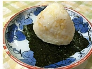
天かすのおにぎり 天つゆ と 天かす う〜む、これは天むすだ！