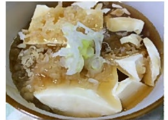
揚げてないけど揚げだし豆腐(風) 揚げてないのに揚げだし豆腐とは…… 乗っけることで それっぽく時短 酒もうまい