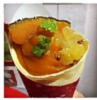
さつまいもをトッピング 美味しそう♪