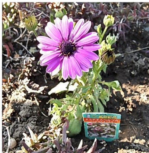
オステオスペルマム

うーん、植えてしまってから庭植えには向かない事を知りました。自分に都合の良いように考えて植えましたが、ちょっと甘かったかな？でも、精一杯咲かせて見せます。