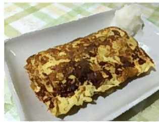
天かすの出し巻き卵 さくっとした食感がやや残り美味