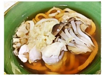
定番のうどん 天ぷらなくても天ぷらうどん(気分)