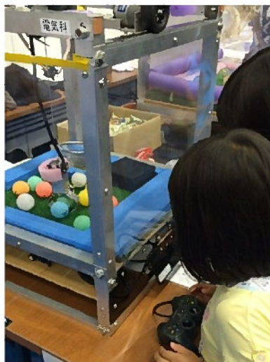
ピンポン玉を使った UFO キャッチャー。高校生の作品というから驚きです。