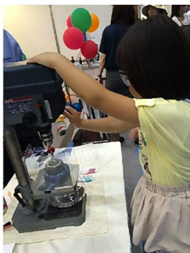
ボールペンのキャップ先端にドリルで穴を開ける体験です。かなり緊張しています。