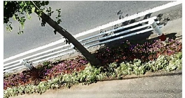
こんな風に花で埋め尽くしたい