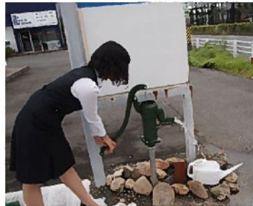
井戸は相変わらず大活躍です

何年かかるか見当が付きませんが、最終的には花で埋め尽くされた華やかで美しい花壇になる予定です。その時を楽しみにして下さい！