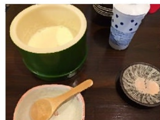
寄せ豆腐 ↑ (その場で作るよ、温かい)