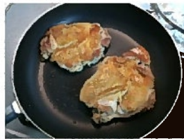
鶏肉から出てきた油は捨ててて両面焼いたら出来上がり

バナナの保管に便利なのがこちらのアイテム「バナナツリー」。バナナは接地している底面がいち早く痛んでくると言われています。バナナツリーを利用すれば宙に浮くので痛みにくいというわけです。特に夏は熟するのがとても速いので本アイテムが効果を発揮します。でもなくても全然困りません。食べごろサインであるシュガースポット(茶色のぷつぷつ)が出てきたら、冷蔵庫の野菜室に放り込んでしまえばよいのです。熟すスピードはゆっくりになり痛みにくくなります。ただし、冷蔵庫に入れると皮の色が全体的に茶色く変色します。見た目は悪いですが可食部は無事です。