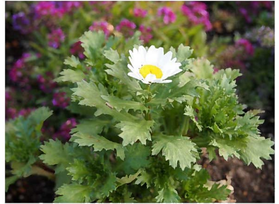
厳しい寒さの中にも負けず 小さくてもたくましく咲き続ける ノースポール

晩秋に植えた花が寒さに負けて枯れてしまったけれど竹本がもらって来たノースポールを植えてみました。こんな寒い日の中でも丈夫に育ちました。毎日、土が凍って植えられなかったので1週間ぐらい外に放置していました。余りの寒さが続いたので半分あきらめていましたが、折角持ってきてくれた花なのでダメ元で植えてみました。パンジーも枯れて行く中、ノースポールだけは元気に育っています。丈夫な花はたくましいです。花も葉も凜として寒さにも負けませんシャキッとしています。この花を見て、私達も地球屋もこんな寒さなんかには負けておられません。