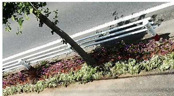
こんな風に花で埋め尽くしたい (分かりますかね？)