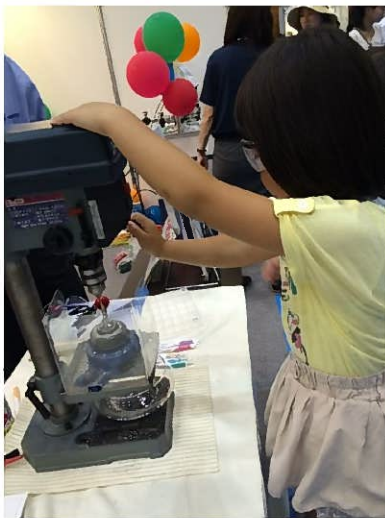
ボールペンのキャップ先端にドリルで穴を開ける体験です。かなり緊張しています。