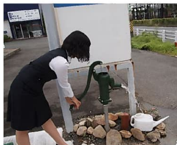
井戸は相変わらず大活躍です

何年かかるか見当が付きませんが、最終的には花で埋め尽くされた華やかで美しい花壇になる予定です。その時を楽しみにして下さい！