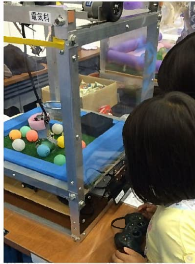
ピンポン玉を使った UFO キャッチャー。高校生の作品というから驚きです。