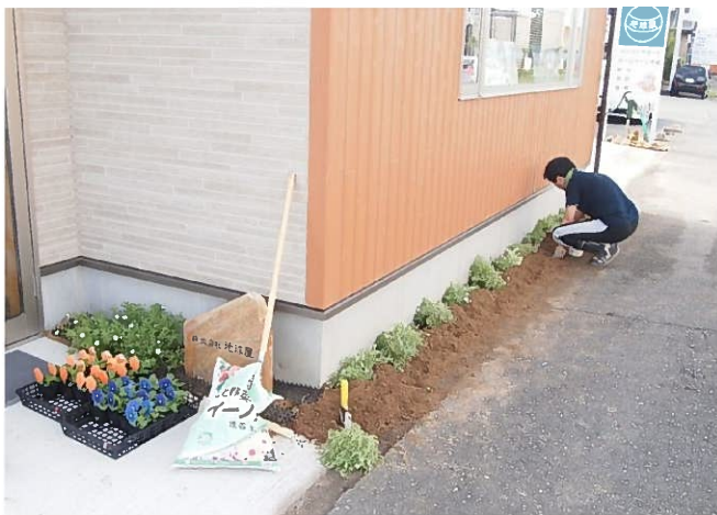
青とオレンジのパンジー

土壌を整えて、いよいよ花を植えてみました。秋からはパンジーとビオラの季節です。色取り取り、華やかに咲いてくれることを願って…。