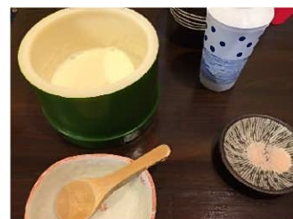
寄せ豆腐 ↑ (その場で作るよ、温かい)