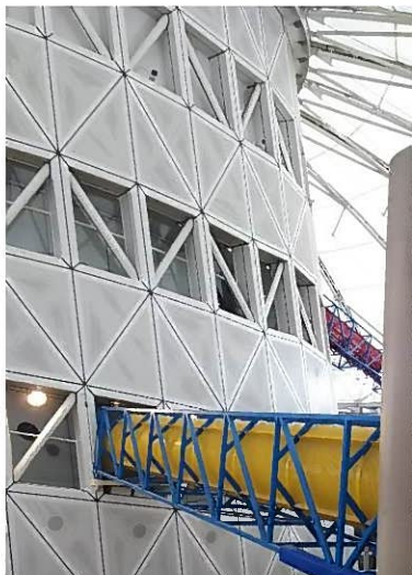
真ん中に見える塔を登ると

最近が一番上の子が小4で一番下の子がもうすぐ2歳と年齢差が大きいので、みんなが一緒に楽しめる場所を探すのが大変ですが、ここはどの年代でも楽しく遊べそうでした。