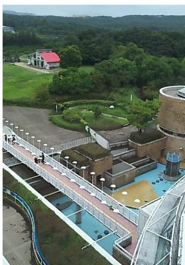
→ 展望台からの眺めは最高