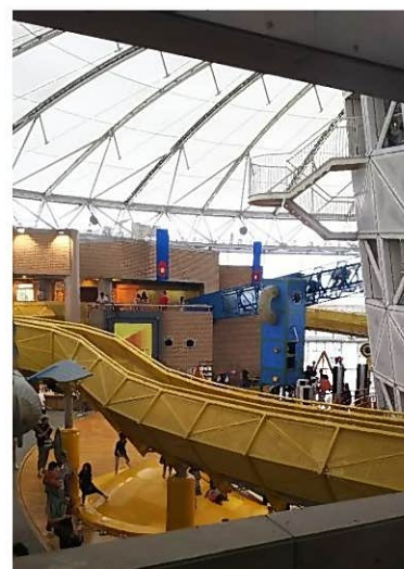
色々ありすぎて写真撮りづらい(笑)