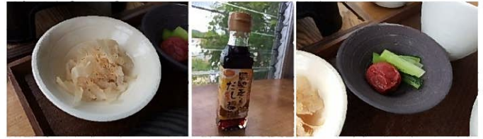
TKG 専用だし醤油 鶏ぶし(×鰹節)

お釜のご飯は思ったほど多くないので、茶碗に小盛にして卵を割り入れます。いつもより卵多めでちょっと？かなり贅沢感があります。たまごかけごはんでもこうも気分が高まることがあったかな？