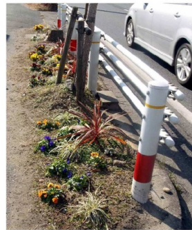
毎朝5分草取りを続け、何とか花を咲かせました

先日の雪の日の渋滞には本当に参りました。当日の午前中は普段2~3分で移動できる距離が30分間以上かかってしまいました。事務所についてからも状況が変わらず何事かと思っていました。