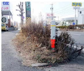
以前、こんな感じでした

昨秋、植えた花が年末まではまあまあきれいでした。しかし、この冬の厳しさと先日の雪で元気がなくなり、残念です。草を取らない以前は、左の写真のように草ぼうぼうでした。草が多いとタバコは捨てられるし、缶やゴミをどんどん投げられてしまったけれど、少しきれいにしただけで、少し減りました。いつか、この通りの豊橋・豊川間が花の咲く通りになったらと願って頑張ってみます。