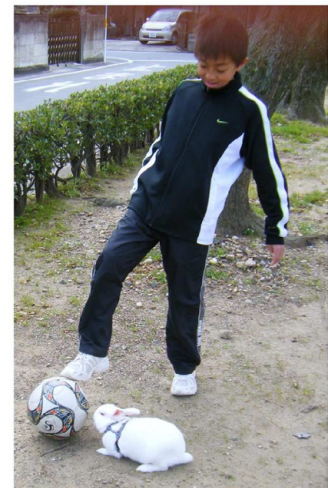
サッカーが好きです

離れた所に置いてきて、手を叩くと飛んで来る時です。気まぐれですが 面白い動物です。