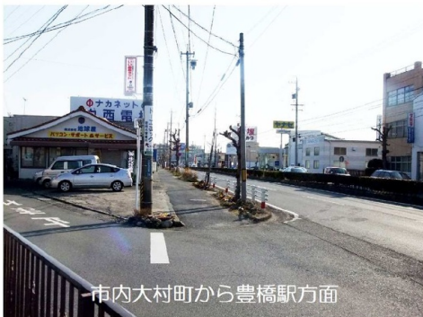
市内大村町から豊橋駅方面

戦前、豊川には海軍工廠が置かれており、本路線は同工廠と豊橋を結ぶ軍用道路として当時から整備されていたようです。どうか平和な状態が続き、街道に花が咲き続く道になればと思い雑草のたくましさには負けないよう、毎日朝5分のみ草と戦っています。