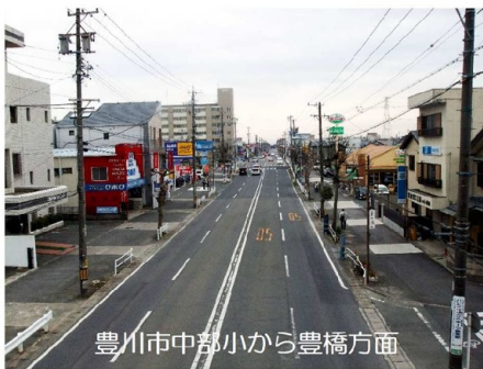
豊川市中部小から豊橋方面

豊川街道は、昔1車線ずつの2車線しかなく、舗装もしてなく田んぼの中の道でした。通りには空き地が多かった。豊川側は南大通りと呼ばれ、名鉄豊川線踏み切り・佐奈川・豊川市民病院・牛久保小学校・飯田線・豊川放水路と続いていました。佐奈川は桜並木になっており、春になると桜が美しい。河原には色々な花も咲き、年中散歩の人が絶えません。牛久保には、ふとんのオオギヤさんの向かい側にスケート場があって、子供の頃数回滑りに行った思い出があります。さらに豊橋寄りに今