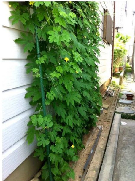
緑のカーテンができあがりました