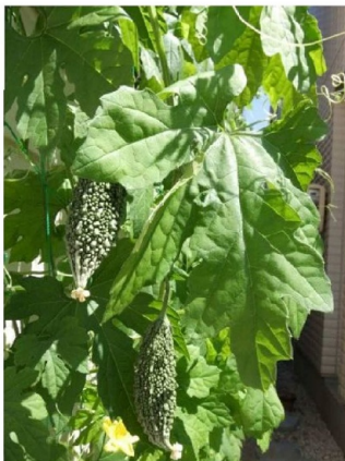
りっぱな実が付きました

初めて食べた時はこんな苦い物は食べられないと思いましたが、今では夏の好物となり夏バテ防止にも役立っています。