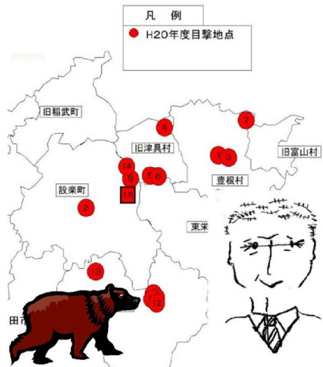
ツキノワグマ出没情報