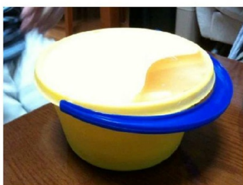
バケツをひっくり返すと… 圧倒的存在感！