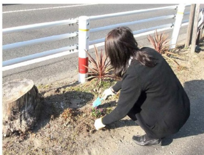
アリッサムを植えました♪