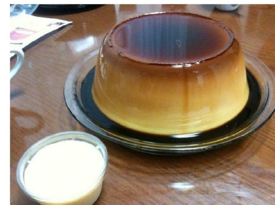
サッカーボールよりでかい！ 普通のプリン何十個分かな？