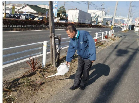
今度はがんばって咲いてくれよ♪

白いアリッサムはすでに植えてありましたので、今度は明るいピンク系の色の物に揃えました。