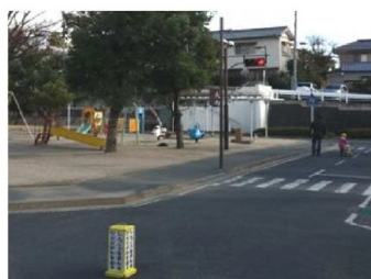
交差点には信号機