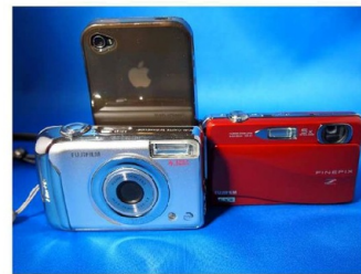
⑤デジカメ(5年前) ⑥デジカメ(2年前)