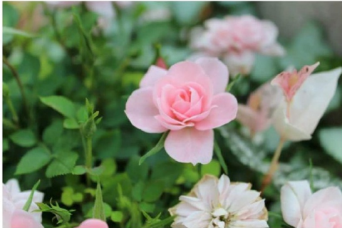
②ミラーレス一眼 OLYMPUS E-PL2

どんどん新しく良い物が発売されるので、買うタイミングに迷ってしまいます。 使いたい時が買う時でしょうか？