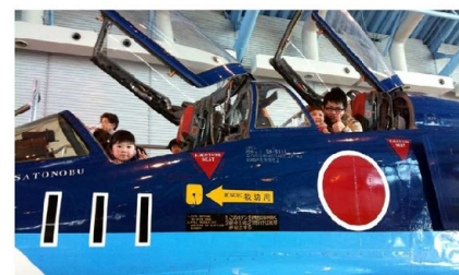
操縦席にも乗れちゃいました 小さくて見えないけれど、ボクが乗っています。