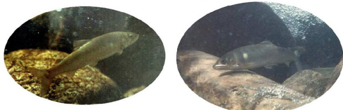
水中カメラで撮りました

山ではメジロと言う小鳥を捕まえたり、川では潜って鮎を取ったりしました。今でも子供の頃の楽しいそのシーンを時々思い出します。特に山での生活は、のんびりとゆったりが基本でした。当時は気が付きませんでした。深緑での生活はオゾンが一杯ですね。