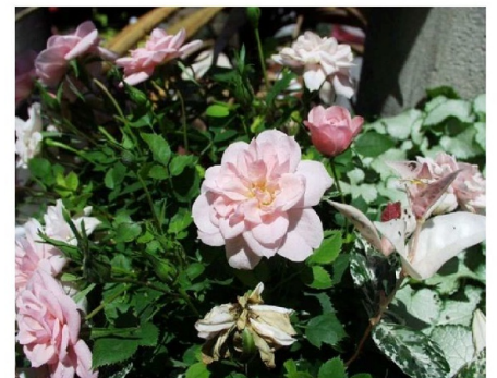
⑥FUJIFILM FinePix Z700EXR