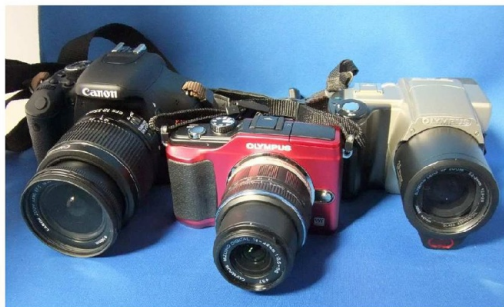
①一眼レフ ②ミラーレス ③デジカメ(13年前)