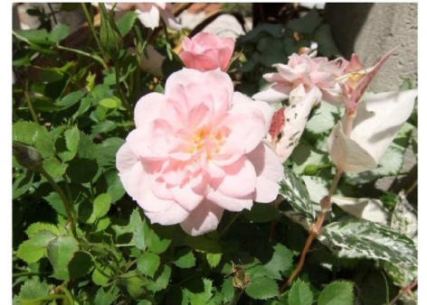
③デジカメ OLYMPUS C2500-L