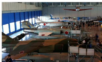
展示場内はこんな感じ