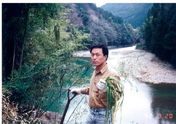
山での作業は楽しいです

最近、東栄町にお客様ができて、定期的に訪問しています。ちょっと距離は遠いですが、リフレッシュの為に喜んで走って通っています。