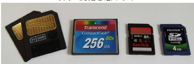
③用の 8MG・32MB スマートメディア ④用の 256MB コンパクトフラッシュ ①②⑤⑥用の 8GB4GB SDカード