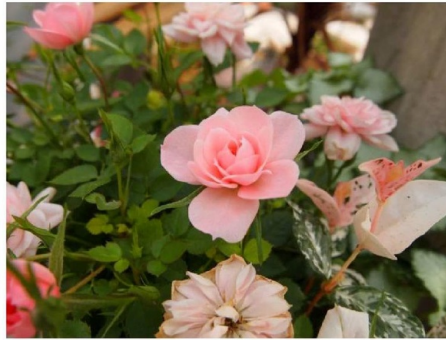
①一眼レフ EosKiss X 5

ここ10年で、デジタルカメラは非常に変化しました。サイズはコンパクトに価格も大変購入しやすくなりました。性能的には比較にならない程アップ、特に画素数はプロが使える程に向上、さらに動画も撮影できるようになりました。