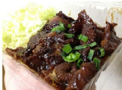
鳥皮肉の味噌焼き