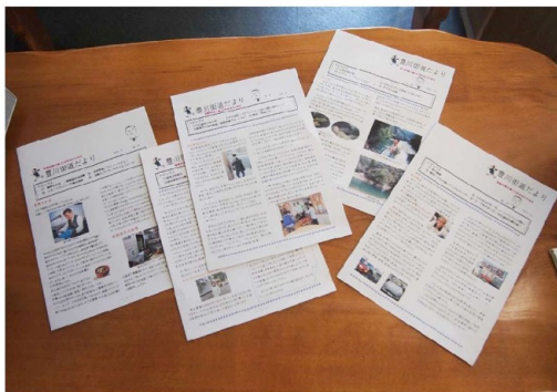
2011年9月～2012年8月 何故か1冊足りません！？

さらに3年間目指して頑張ります。石の上にも3年ですが、あと1年もすれば少しはまともになるかも？ 知れません。改めて、ご意見・ご指導をお待ちしています。よろしくお願い致します。