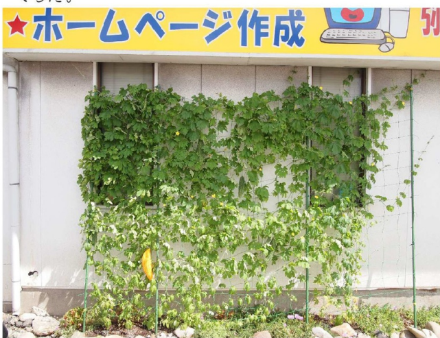
ゴーヤが育ちました

できた実は食卓を飾ってくれ、今年は1回も買わずに自家製ともらい物のゴーヤで間に合い、おサイフ的にもありがたいカーテンでした。来年も挑戦してみます。