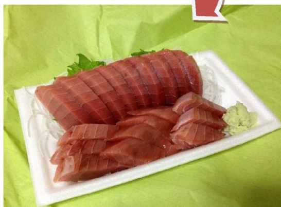
絶品マグロのおさしみ