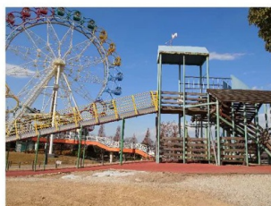
観覧車とローラーすべり台