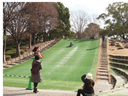
子供が大興奮の芝滑り