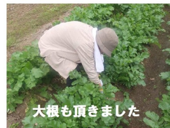
大根も頂きました