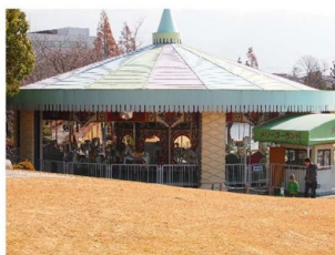
多めに回るメリーゴーランド

今回は安城市にある堀内公園についてです。豊橋から車で1時間半くらいかかります。とてもキレイな公園で観覧車にメリーゴーランドに自動車と有料ですが公園とは思えないくらい遊具が充実しています。もちろん無料で遊べる遊具もすべり台やアスレチック、ターザンロープに自転車や三輪車で走るミニサーキットとたくさんあります。特に人気があったのは芝滑りで、人工芝の上をソリに乗って滑り下りていくのですが、意外とスピード出てます。最初は大丈夫かなあ？と少し心配でしたが、係りの方が見てくれるので安心して遊ぶことができました。メリーゴーランドや観覧車は有料といっても1回100円と格安なので、ついつい子供の「もう1回！」の言葉に負けてしまい、気付いたら意外と・・・なんてこともいい思い出です(笑)