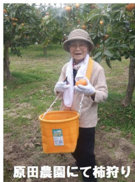
原田農園にて柿狩り