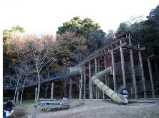
子供に大人気のアスレチック(御油側)

今回は豊川市御油町にある東三河ふるさと公園です。こちらは過去に紹介した「こどもの国」に並ぶ広さの公園で、公園と呼ぶよりは山を楽しむ散策路に近い気がします。四季折々の風景をふんだんに楽しむことができます。公園への入り口が御津側と御油側の2か所あり、2度楽しむことができます。子供を連れて1日で全てを回りきるのは大変です。今後も遊具エリアが拡大していくようなので楽しみです。