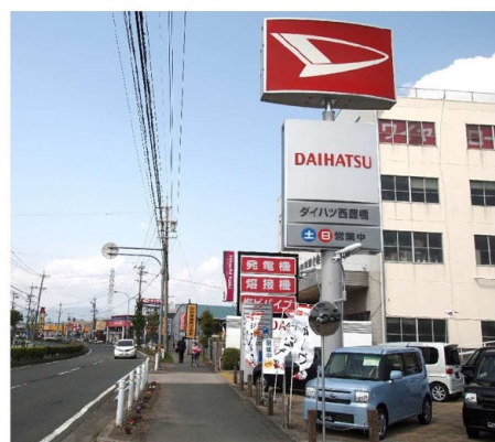
同じ街道の若松彌株式会社さん

毎日、15分位かけて草を取ったり、咲き終わった花を摘んでいます。花を摘むと、また元気に新しいつぼみが出てきます。