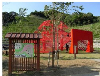
大きな赤いネット遊具(御津側)

【東三河ふるさと公園】 住所:豊川市御油町滝ヶ入11-2 東三河ふるさと公園 【検索】