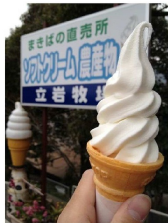
ソフトクリーム (やや小ぶり)