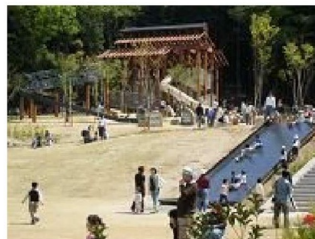
結構スピードが出る滑り台(御油側)