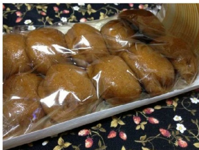
紅屋さんのみそまん (もっちり美味しい)