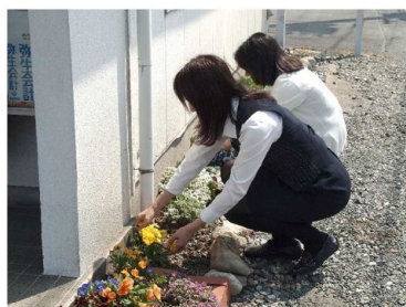
花を摘んでいます