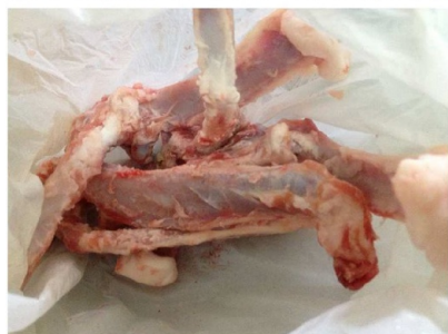
↑とんこつ(豚の骨) ↓ラーメンの完成!

美味いっ！美味しいのですが、少量のラーメンを作るために小さな鍋でのスープ作りは時間がかかるため、労力に見合わないような気がします。お店で食べたほうが楽ちんですね。