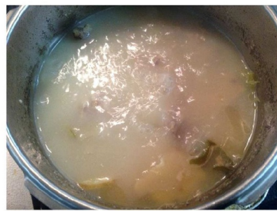
↑スープもうすぐ完成