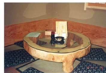
豊川市御油町の久寿しさん内にて