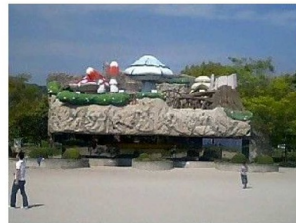
屋外にあるアスレチック