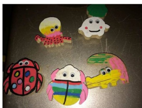
ペンで色塗りできるマグネット

おかざき世界子ども美術博物館 住所：岡崎市岡町字鳥居1番地1 ホームページ：「おかざき世界子ども美術博物館」で検索！（岡崎市 HP 内）