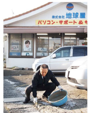
私は左官屋さんです

駐車場は県道と市道に挟まれていますので、通過する車から時々ゴミを捨てられます。毎朝、メゲずに草取りしながらゴミ拾いに挑戦しています。