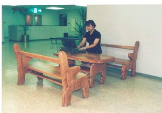
25年前の写真、この応接と机は今でも社内で現役です。