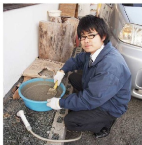
ボクはセメントをコネる係

納税する力がありませんので、市道も県道も事務所の廻りは自社でメンテナンスします。