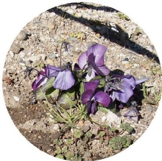
やはり、霜には弱いです