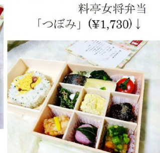
料亭女将弁当 「つぼみ」(¥1,730)↓