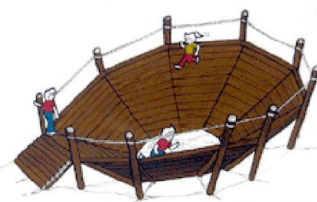
まん中に落ちないように、反時計回りに3周走る