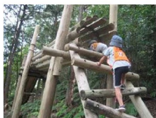
アスレチック写真