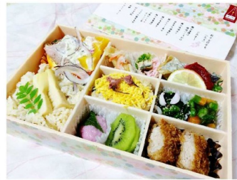
↑料亭女将弁当 「花舞」(¥2,160)

ました。レジで聞くと「一日2・3個の入荷ですね」。なんという少なさ。これは思わぬ超激レア級のアイテム。手に入れたお弁当は岡崎市の食事処「おぎ乃」さんが作る 料亭女将弁当「つぼみ」と「花舞」。高い？けれどお値段に見合った内容だと思います。次のシーズンの弁当も楽しみです。(クーラーボックスで自宅に持ち帰り 呑みながら頂きました)