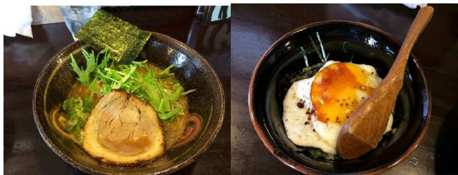
ランチで食べた ↑ 「の一まる」(しょうゆ)

まんまる堂さんへは高速道路を使えば1時間ほど。射程距離ですね。ビールは飲めないけれど、うーん悩ましい。おなかすいた……。 (記事を書いているのはお昼の12時ちよつと前)