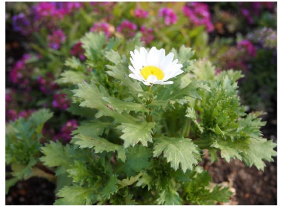
厳しい寒さの中にも負けず 小さくてもたくましく咲き続ける ノースポール

晩秋に植えた花が寒さに負けて枯れてしまったけれど竹本がもらって来たノースポールを植えてみました。こんな寒い日の中でも丈夫に育ちました。毎日、土が凍って植えられなかったので1週間ぐらい外に放置していました。余りの寒さが続いたので半分あきらめていましたが、折角持ってきてくれた花なのでダメ元で植えてみました。パンジーも枯れて行く中、ノースポールだけは元気に育っています。丈夫な花はたくましいです。花も葉も凜として寒さにも負けませんシャキッとしています。この花を見て、私達も地球屋もこんな寒さなんかには負けておられません。