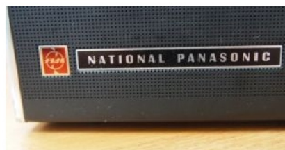
Panasonicブランドは50年前から健在です！

こんなに持ちの良い製品が復活したら、日本の経済は成り立たないかも知れないが、ゴミのない世の中になって無駄のない超省エネの美しい地球社会になるのにと勝手に思い込んでいます。