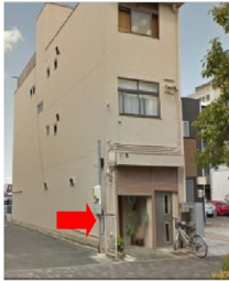
(Google ストリートビューより)

隠れた名店というのは言葉では良く聞くけれど、こんなに隠れていて良いの？こちら 正面から見ないとお店と気づかないし正面から見ても店名しか書いてないから飲食店と気づかないかもしれない、そんな「一宙(イチチュウ)」さん。知っている人しかこないよね？と不思議に思ってしまった。