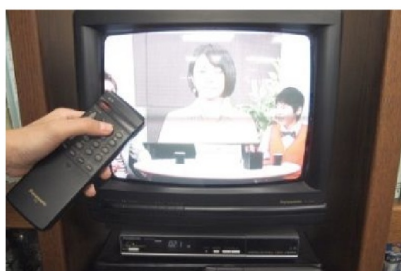
元気を取り戻しました！

30分ぐらいしてから、あきらめきれずに、コンセントを入れ直して、しつこく再度スイッチをONしたところ、何といつものように普通に見る事ができました。