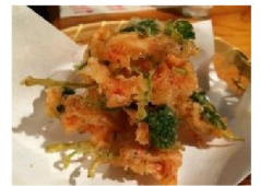
桜えびと三つ葉の かき揚げ天→