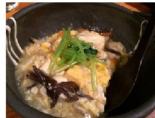
←優しい味の 野菜の煮物 (山芋すりおろし入り)