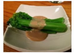
アスパラ菜と 自家製ごまだれ→