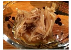
自家製 なめ茸おろし→