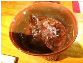
初めて飲んだ焼酎(ロック)。 麦と芋。まだ初心者だから麦の方は癖が少なく飲みやすかったかな？ 芋焼酎は芋の味が濃いね。 ロックで頂きました。 ← 芋焼酎

訪問のきっかけはよく行く酒屋さん「栄屋酒店」の親父さんにウイスキー 飲んだことないのでグラスで飲めて料理の美味しいところを相談したこと。2回目の今回はまたしても 飲んだことのない焼酎の味を知るために。手作りの料理はその時々で異なるようです。次は予約してから来てね～って言われたから予約したら気合い入れて料理を用意してくれるのかな？