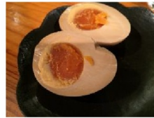
←茹で卵の 味噌&麴漬け