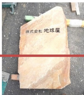
下半分を埋めます

社内だけでなく、必要な時に常日頃大変お世話になっているご近所さんにも使って頂けたら幸いです。 水道工事屋の社長さん、早速水を出して頂いてありがとうございます。とても嬉しいです！