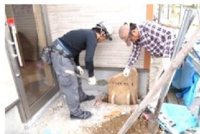
上下左右のバランス 慎重に合わせます