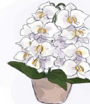
趣味はお絵描き (パソコンで描きました)