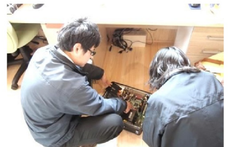
右の「もさもさ」が私です