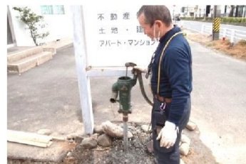
おおっ！ 出始めたぞ！

社内だけでなく、必要な時に常日頃大変お世話になっているご近所さんにも使って頂けたら幸いです。 水道工事屋の社長さん、早速水を出して頂いてありがとうございます。とても嬉しいです！