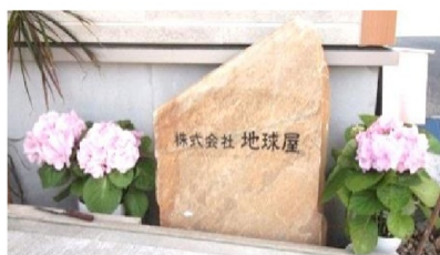
地球屋を末永く宜しくお願いします

弊社のお客様の 看板屋さんで、創って いらっしゃる石の看板！ あこがれていました！ やっと出来ました！ 予算の関係で