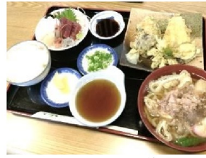
フキトウの野菜天

営業時間 11:00~14:00 17:30~21:00 定休日 月曜日の夜と火曜日