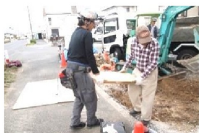
小さくても結構重たい