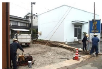
さあ、掘り始めます！

目的は花に水をやるためですが、井戸の水汲みは結構楽しいです。これで暑い夏でも思う存分、花に水をあげられます。あつてはならないですが、万一災害が起きた時でもいろいろな用途に使用できると思います。