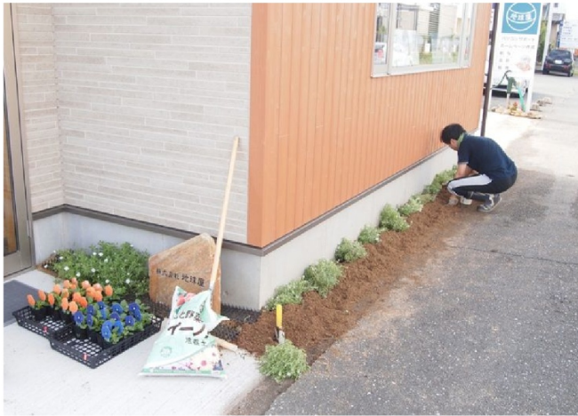
青とオレンジのパンジー

土壌を整えて、いよいよ花を植えてみました。秋からはパンジーとピオラの季節です。色取り取り、華やかに咲いてくれることを願って…。