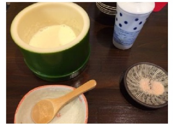
寄せ豆腐 ↑ (その場で作るよ、温かい)