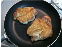
鶏肉から出てきた油は捨てて両面焼いたら出来上がり

バナナの保管に便利なのがこちらのアイテム「バナナツリー」。バナナは接地している底面がいち早く痛んでくると言われています。バナナツリーを利用すれば宙に浮くので痛みにくいというわけです。特に夏は熟するのがとても速いので本アイテムが効果を発揮します。でもなくても全然困りません。食べごろサインであるシュガースポット(茶色のぷつぷつ)が出てきたら、冷蔵庫の野菜室に放り込んでしまえばよいのです。熟すスピードはゆっくりになり痛みにくくなります。ただし、冷蔵庫に入れると皮の色が全体的に茶色く変色します。見た目は悪いですが可食部は無事です。