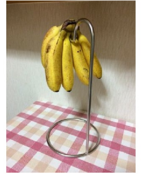
写真はモンキーバナナ

バナナの保管に便利なのがこちらのアイテム「バナナツリー」。バナナは接地している底面がいち早く痛んでくると言われています。バナナツリーを利用すれば宙に浮くので痛みにくいというわけです。特に夏は熟するのがとても速いので本アイテムが効果を発揮します。でもなくても全然困りません。食べごろサインであるシュガースポット(茶色のぷつぷつ)が出てきたら、冷蔵庫の野菜室に放り込んでしまえばよいのです。熟すスピードはゆっくりになり痛みにくくなります。ただし、冷蔵庫に入れると皮の色が全体的に茶色く変色します。見た目は悪いですが可食部は無事です。