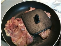
ミートプレスをずらしながら弱火でゆっくり皮目を焼き上げます