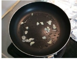
ニンニクを炒めて香りを出します

肉を焼くときに便利なのがこちらのアイテム「ミートプレス」。例えばチキンステーキ(チキンソテー)を作る際使えば、あの「ぱりぱりチキン」が簡単に作れます。仕組みは簡単です。重量が1Kg以上あるミートプレスが鶏肉を押さえつけることでフライパンに密着し皮目がしっかりと焼き上げられます。普通に焼いたのでは鶏肉は凸凹しているので焼きムラができてしまいます。全体がぱりぱりになりません。でもなくても全然困りません。ネットで調べればわかりますが、キッチンシートやアルミホイルを敷いて上から水を入れた鍋やかんを置くという方法で代用できるそうです。