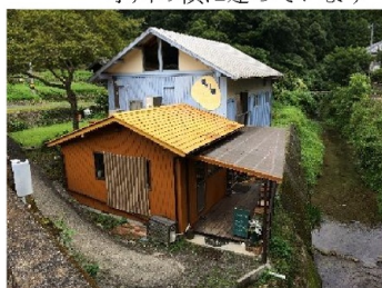
小川の横に建っています

いつも買うクッキーは常時4種類が大きな瓶に入って売っています。大量に購入し、最初はややしっとりしていますが、1日2日と徐々に水分が抜けて数日後にはサクツとしてくる変化も楽しめます。お土産でお持ちすると受けがとても良いです。私にとってはクッキー屋ですけど、たまにタルトやシフォンケーキを購入することもあります。デコレーションされたような派手さはないけれど丁寧さ、季節を感じられる新商品、甘すぎないところ、一番は美味しいところなのですがお勧めです、すごく。