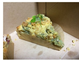
↑季節ごとに種類が変わるタルト↓