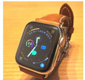
↑ベルトは別購入で皮革製に変更しました

スマートフォンと連動するデジタル腕時計「スマートウォッチ」。iPhoneを使っているので、Apple Watch Series4(2018年9月発売)を購入しました。スマートフォンは多機能で常に身に付けて使う製品ですが、我慢できなかったことがあります。「ポケットに入れていると、でかくて邪魔だし、膨らんでカッコ悪い」。そのようなわけで、スマホと連動して動作するスマートウォッチに興味を持っていました。実際に使ってみてスマートウォッチは機能面でも少なからず生活が改善されたように感じます。