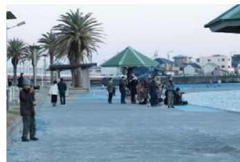
▲スタンバイ中の人たち