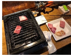
肉1枚に思いを込めて焼きます→

すね。ちょっと食べたいとき、がっつり食べたいときどっちもいけます。大人数は難しいけれど、一人でも入れてお勤めです。