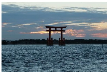
▲曇りの日の残念な写真