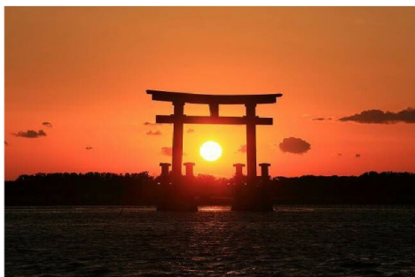
▲晴れた日にはこんな光景が…