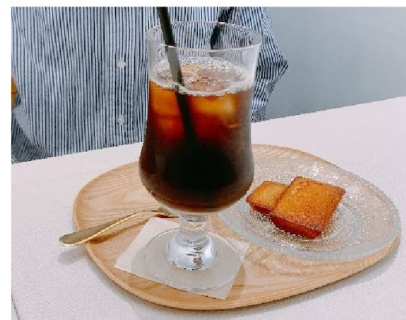
バターの森 名古屋市中区大須4丁目1-79 第2 ハヤシビル 1F

テイクアウトにはフィナンシェ以外にクッキーもあり。ダイヤモンドクッキーが本当に美味しかった！バジル味など珍しいフィナンシェもあったので、次回挑戦してみたい…。